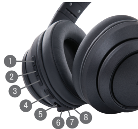
DIAGRAMA DE PRODUCTO