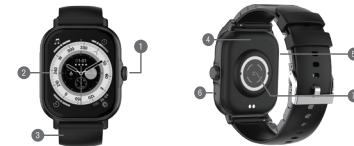
DIAGRAMA DE PRODUCTO