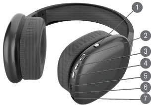
DIAGRAMA DE PRODUCTO