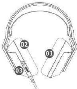
DIAGRAMA DE PRODUCTO